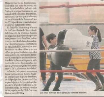
Megaxove cerró su decimoquinta edición con más de 10.000 visitas de toda Galicia y el norte de Portugal, que participaron en las más de 200 opciones deportivas, culturales y de ocio que se ofrecían en este Salón de la Juventud, en los 37 expositores repartidos por el recinto del feriado. El fútbol humano y el área de la Concejalía de Xuventud do Concello de Ourense fueron los espacios más visitados por los jóvenes y sus familias, mientras que los hinchables, los animadores los videojuegos, con torneos de FIFA incluidos, fueron los preferidos de muchos niños y no tan niños, ya que actuaban como los simuladores de conducción. Destaca la atención de muchos adultos. También hubo espacio para la solidaridad a través de campañas como la Operación Quilo de Atención a la vejez de "Asíntomas a Asistencia". Además, Megaxove contó con la participación de Sergio Vallejo, campeón de España de rallies de Felipe Iglesias, campeón de Europa de Judo, o del propio José Gago, sexto Día de Wushu por la Federación China de Wushu y varios de los jugadores del Club Ourense Baloncesto (COB). Una visita detallada de un particular combate de boxeo.