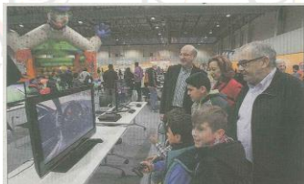
Primera jornada de Megaxove. 7 de mayo