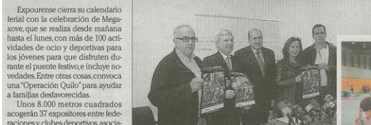
Unos 8.000 metros cuadrados acogieron 37 expositores entre federaciones y clubes deportivos, asociaciones...